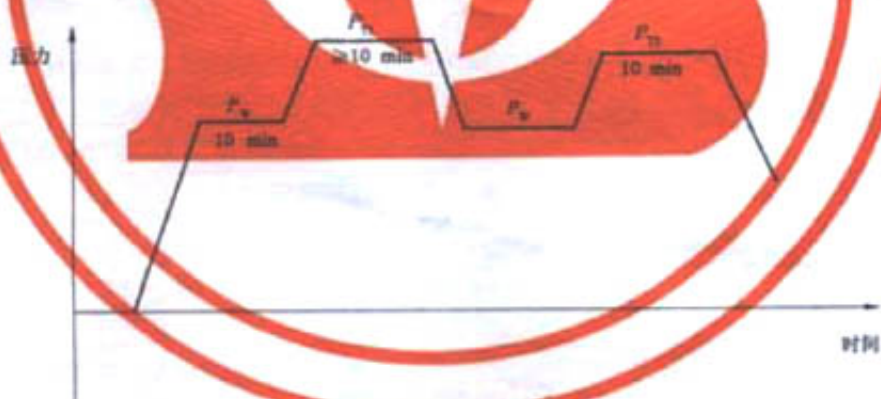
图2 在用压力容器的加压程序

在用压力容器的加压程序见图2。声发射检测在达到压力容器最高工作压力 P_w 的50%前开始进行,并至少在压力分别达到最高工作压力 P_w 和最高试验压力 P_{T1} 时进行保压。如果声发射数据指示可能有活性缺陷存在或不确定,应从最高工作压力 P_w 开始进行第二次加压检测,第二次加压检测的最高试验压力 P_{T2} 应不超过第一次加压的最高试验压力 P_{T1} ,建议 P_{T2} 为97% P_{T1} 。